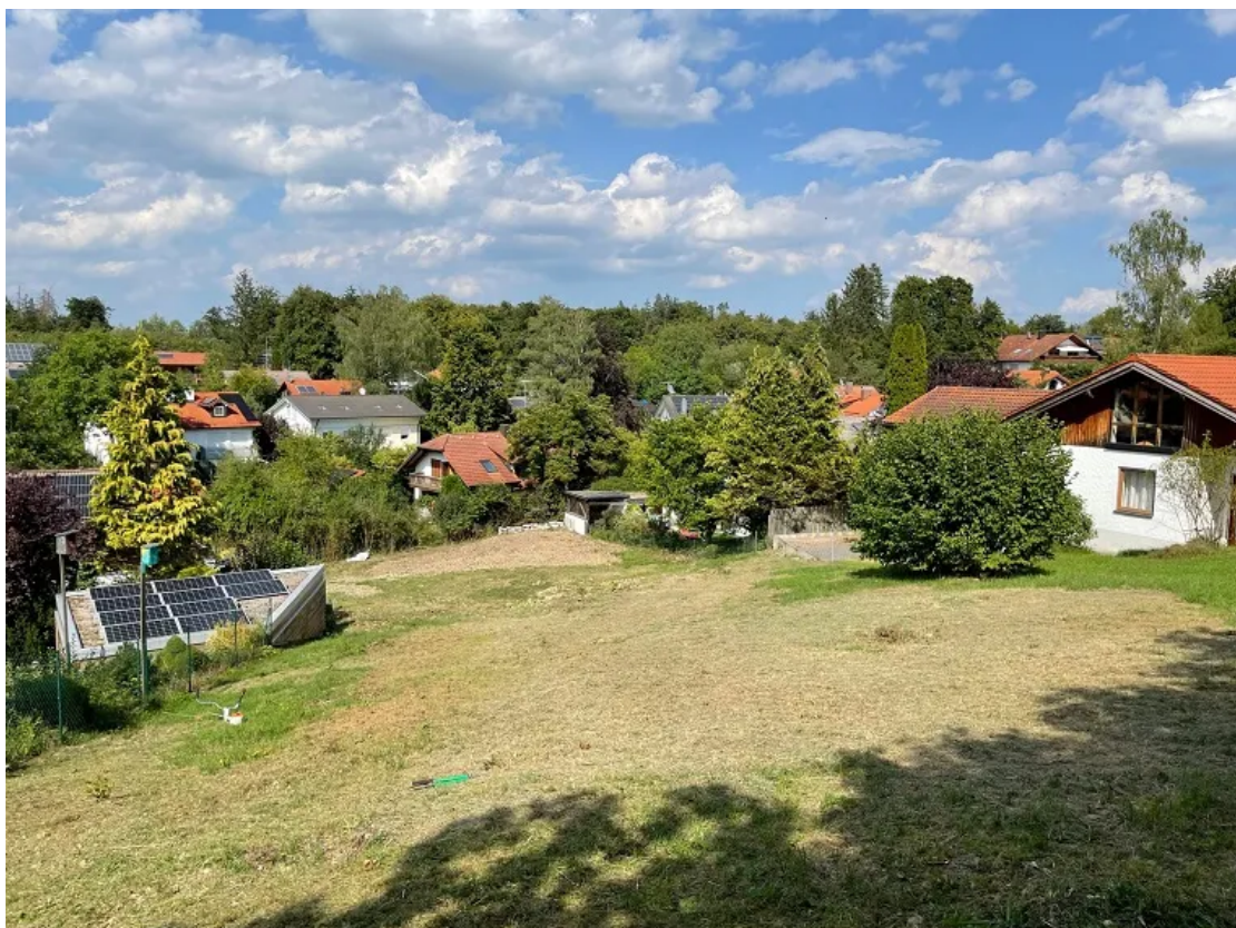
Blick vom Grundstück (von oben nach unten)